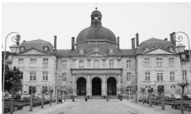
Госпиталь Ла Сальпетриер

Профессор Жан Мартен Шарко родился в Париже 29-го ноября 1825 г. Он происходил из небогатой семьи, основными принципами которой были честность и трудолюбие. Отец Ж. М. Шарко, в связи с ограниченными материальными возможностями, мог дать дорого стоящее во Франции высшее образование только одному из трех своих сыновей. Он принял решение, что продолжать дальше обучение будет тот из них, кто при обучении в начальной школе проявит наилучшие способности. Жан Мартен в этом отношении значительно превзошел своих братьев, поэтому он продолжил учебу, поступив в лицей Saint-Louis, а в 1844 году — на медицинский факультет университета Сорбонны. По окончании учебы он открыл собственный кабинет в неприметном доме на улице Лафит в Париже, совмещая частную практику с преподаванием на медицинском факультете. Однажды, пройдясь по палатам госпиталя в Ла Сальпетриер и увидев сотни тяжелых больных, лишенных элементарной помощи, он пережил моральное потрясение и тогда же принял решение: «Сюда нужно вернуться и здесь остаться». В 1848 году, в возрасте двадцати трех лет, он становится интерном в госпитале Ла Сальпетриер.