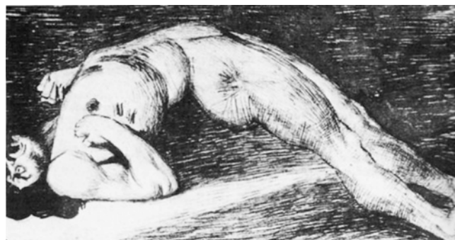
Рисунок, що відображає приступ істерическої дуги у пацієнтки клініки Ла Сальпетриєр

ідею». Заключальний період нападу описувався як період поступового відновлення ясності свідомості з залишковими якими, образними зоровими сприйняттями. З точки зору Ж. М. Шарко, емоції хворих також представляли з себе істерическі симптоми, а мова хворих в час істерических епізодів — бессмысленную «вербализацию» .