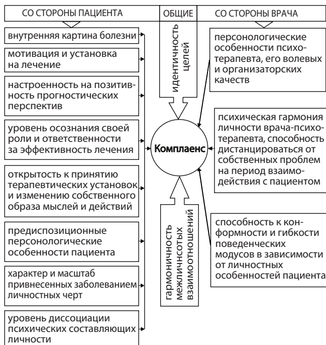
Рис. 1. Факторы, предопределяющие комплаенс к терапии

Факторы, предопределяющие комплаенс к терапии, в схематическом виде приведены на рисунке 1.