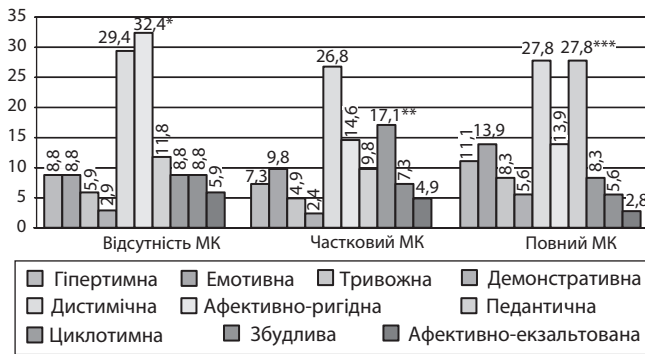
Рис. 1. Розподіл типів акцентуацій характеру у хворих з різним рівнем МК при депресивному епізоді

Умовні позначення: відмінності достовірні (при p < 0,01 ): * — порівняно з підгрупою хворих з повним МК; ** — порівняно з групами хворих з відсутністю і повним МК; *** — порівняно з підгрупами хворих з відсутністю і частковим МК