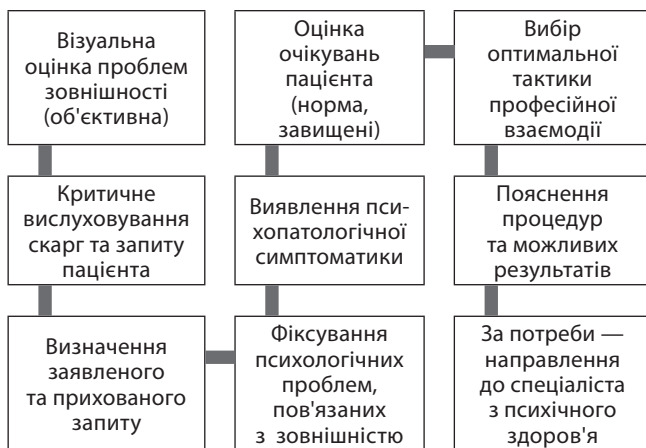
Рис. 3. Алгоритм взаємодії косметолога з пацієнтом при первинному зверненні

Персоналу косметологічних центрів у зв'язку зі специфікою своєї діяльності доводиться самостійно опанувати засади психодіагностики та психологічного консультування, надавати не лише косметологічні послуги, але і ситуаційно проводити психологічні втручання. На рис. 3 та 4 наведені орієнтовні алгоритми взаємодії спеціаліста-косметолога з новим пацієнтом, та його дій у разі наявності ознак психологічних зрушень.