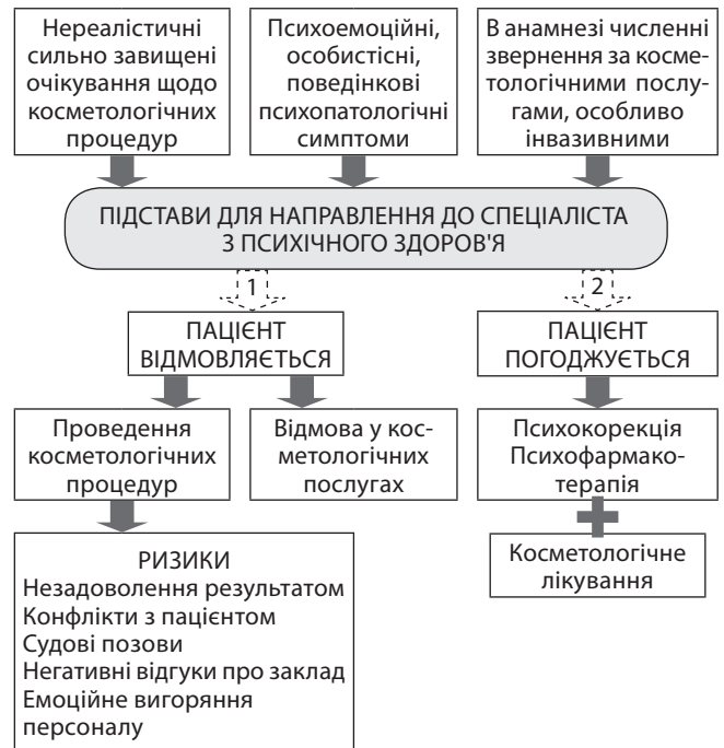
Рис. 4. Алгоритм взаємодії з пацієнтами з психологічними зрушеннями

Долучення до лікування дерматологічних захворювань психокорекційних та психотерапевтичних технік значно покращує результати терапії [27, 28]. У лікуванні шкірної патології застосовують когнітивно-біхевіоральну психотерапію, техніки релаксації, гіпнозу, біологічний зворотний зв'язок. При наявності вираженої психопатологічної симптоматики призначають транквілізатори та антидепресанти.