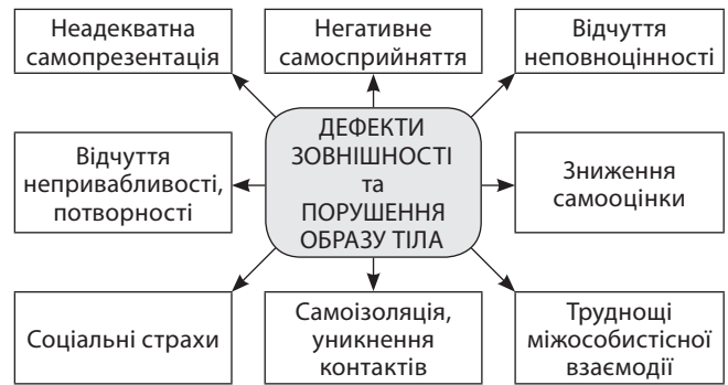
Рис. 2. Порушення образу тіла внаслідок дефектів зовнішності

Порушення образу тіла має негативні особистісні та психосоціальні наслідки, які втілюються у негативному самосприйнятті, відчутті неповноцінності, зниженій самооцінці, труднощах міжособистісної взаємодії — встановленні нових знайомств, пошуку пари, неадекватній самопрезентації, відчутті непривабливості та потворності, соціальних страхах, уникненні контактів з іншими людьми (рис. 2).