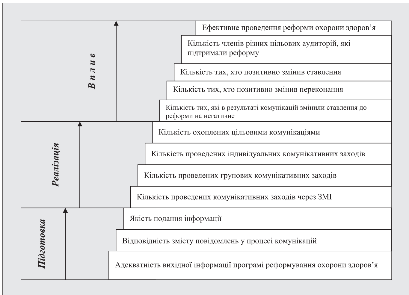
Рис. 1. Етапи та рівні дослідження, оцінка комунікативних програм