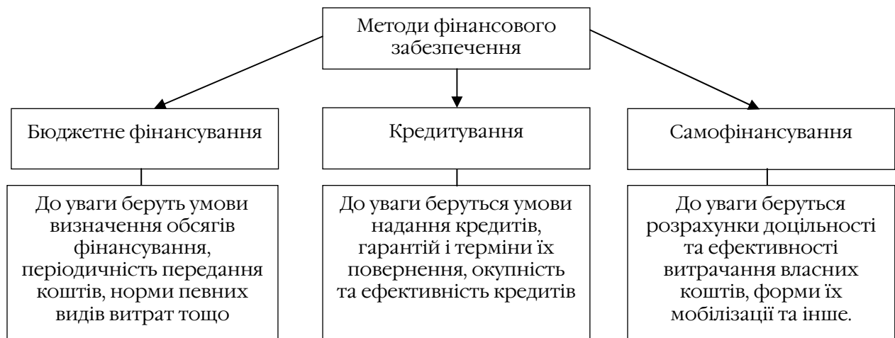
Рис. 2. Методи здійснення фінансового забезпечення