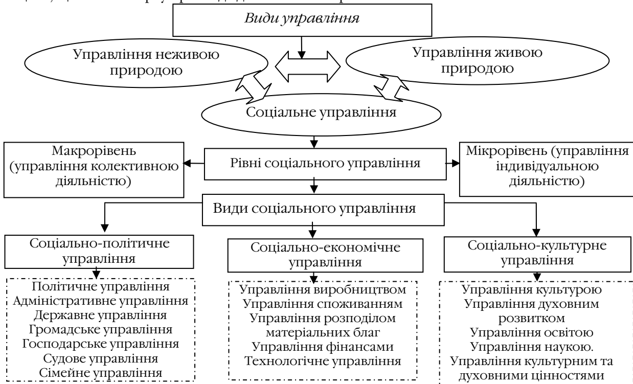
Рис. 1. Класифікація видів управління

Проте, всі сфери організації суспільства тісно переплітаються між собою. Наприклад, якщо рівень освіти та науки буде на низькому та рівні, то результатом цього буде низький рівень робочої сили та неможливість впровадження науково-технічного прогресу у виробництво, що в свою чергу призведе до пониження рівня економіки.