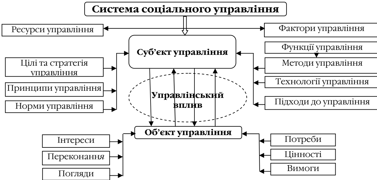
Рис. 3. Система соціального управління