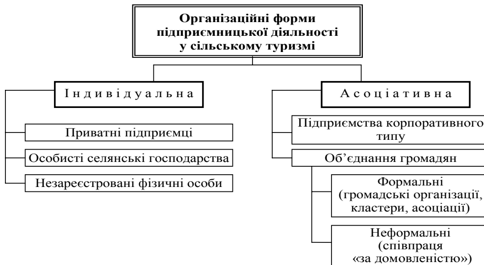
Рис. 1. Організаційні форми сільського зеленого туризму

Підприємництво у сільському зеленому туризмі набуває різних форм (рис. 1). На сучасному етапі переважають (близько 90 %) некорпоративні підприємства, які належать домогосподарствам, тобто індивідуальна незареєстрована форма сільського туристичного бізнесу, в той час як більш ефективним є функціонування формальних інститутів партнерства. Така невідповідність між реальним та бажаним станом пояснюється значною кількістю перешкод формування підприємницького середовища у сільському зеленому туризмі.