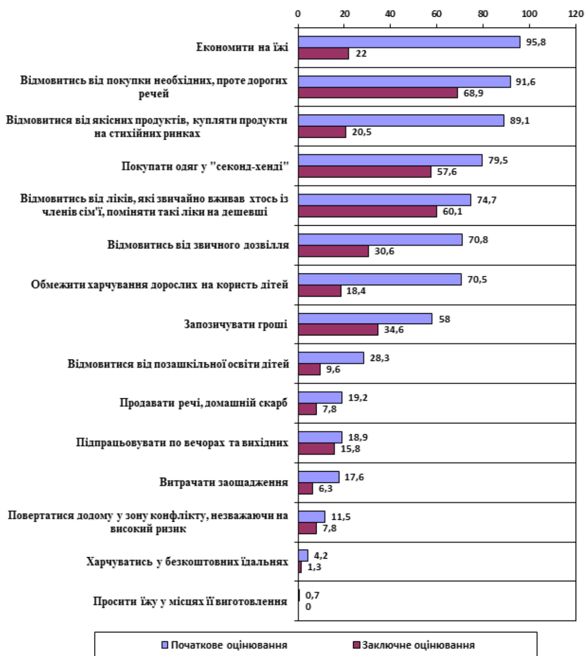
Рис. 3. Порівняння відповідей учасників на запитання: «Що з переліченого вам і членам вашої сім'ї приходилося робити [за останній час] для задоволення основних потреб сім'ї?» під час початкового (n=2831) і заключного (n=396) оцінювання, %.

У ході впровадження соціальної програми значно зменшилася кількість сімей-учасників, які застосовують ризиковані способи виживання, подолання складних ситуацій та вирішення проблем. Так, більш ніж на 40% знизилася частка сімей, які для задоволення базових потреб економили на їжі, відмовлялися від якісних продуктів та купляли продукти на стихійних ринках, обмежували харчування дорослих на користь дітей, відмовлялись від звичного дозвілля; більш ніж на 20% скоротилося число тих, хто відмовлявся від купівлі необхідних, проте дорогих речей, купляв одяг у «секонд-хенді», запозичував гроші, на 10% – тих, хто відмовлявся від позашкільної освіти дітей, від звичних та якісних ліків, витрачав заощадження та продавав домашній скарб (рис. 3).