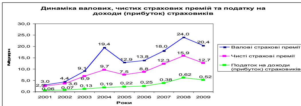
Рис.2. Динаміка валових, чистих страхових премій та податку на доходи (прибуток) страховиків*

рис.2. величина сплачуваного страховиками податку на доходи (прибуток) протягом тривалого терміну точно корелювала з розвитком страхової галузі. Вона характеризувалась тим же трендом, що і величина валових і чистих премій в цілому по ринку, причому не тільки в частці оподаткування доходу у вигляді страхових премій, а в повному своєму обсязі.