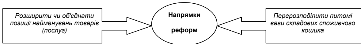
Рис. 1. Складові реформування структури споживчого набору для розрахунку ІСЦ

Доречно відмітити, що дані про структуру споживчих грошових витрат населення отримуються за результатами обстеження умов життя домогосподарств, яке проводиться Державною службою статистики України на щорічній основі. До того ж важливим є той факт, що 1 раз на 5 років відбувається перегляд товарів (послуг) представників цього загальноприйнятого кошика (корегування мали місце в 1996, 2001 та 2006 роках) [3], саме тому на даний момент актуальним постає питання його чергового уточнення. Варіанти напрямків змін відображені на рисунку 1.