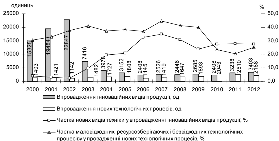
Рис. 2. Впровадження інновацій на промислових підприємствах України у 2000-2012 рр.

Динаміка впровадження інновацій на промислових підприємствах України має нестійкий характер (рис. 2). Протягом 2000-2009 рр. частка маловідходних, ресурсозберігаючих і безвідходних технологічних процесів у впровадженні нових технологічних процесів перевищувала частку нових видів техніки у впровадженні інноваційних видів продукції, на відміну від 2010-2012 рр. Якщо порівняти з 2000 р., у 2012 р. частка нових видів техніки у впровадженні інноваційних видів продукції зросла 6,7 рази і становила 27,7%; частка маловідходних, ресурсозберігаючих і безвідходних технологічних процесів у впровадженні нових технологічних процесів дещо зменшилася (у 1,2 рази) і становила 25,3%. Протягом досліджуваного періоду обсяг впровадження інноваційних видів продукції на промислових підприємствах України перевищував обсяг впровадження нових технологічних процесів. У 2002 р. таке перевищення було найбільшим і становило 20 разів. У 2012 р. впроваджено 3403 найменування інноваційної продукції 704 підприємствами, 2188 інноваційних процесів 703 промисловими підприємствами України (рис. 2).