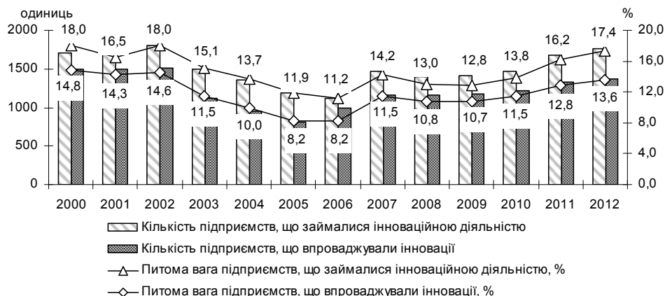
Рис. 1. Динаміка інноваційної активності промислових підприємств України у 2000-2012 рр.

За даними Державної служби статистики України інноваційною діяльністю у промисловості займалися 1758 підприємств або 17,4% обстежених промислових підприємств; упровадженням інновацій – 1371 підприємство або 13,6% обстежених промислових підприємств (рис. 1).