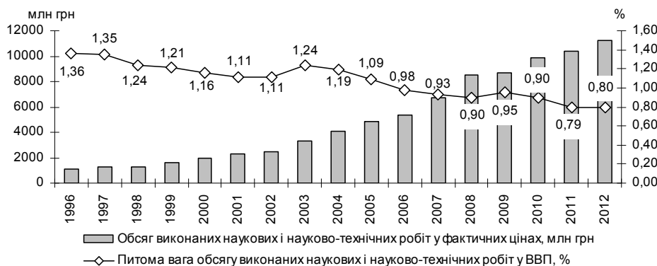
Рис. 4. Динаміка обсягу виконаних наукових і науково-технічних робіт в Україні у 1996-2012 рр.

*Джерело: складено автором за матеріалами Державної служби статистики України [7]