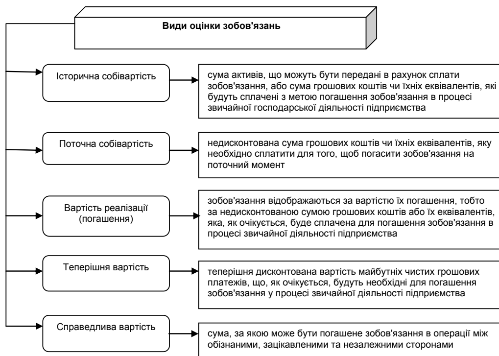
Рис.1. Види оцінок зобов'язань у міжнародній практиці

Відповідно до міжнародних стандартів визначення балансової вартості зобов'язань здійснюють за такими видами оцінок. (Рис.1)