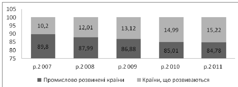
Рис. 1. Структура світового страхового ринку в розрізі зібраних страхових премій промислово розвинених країн та країн, що розвиваються, в 2007-2011 роках, %

зменшилася з 89,8% до 84,78%, тобто, на 5,02%: в 2008 році – на 1,81%; в 2009 році – на 1,11%; в 2010 році – на 1,89%; в 2011 році – на 0,23%. Відповідно частка страхових премій, зібраних країнами, що розвиваються, зросла на 5,02%, і на сьогодні становить 15,22 % (рисунк 1).