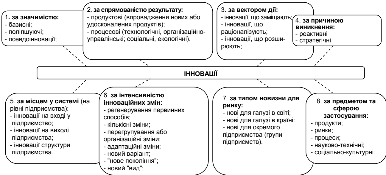
Рис. 1. Класифікація інновацій*

нізації, фінансування і кредитування виробництва, нові підходи до підготовки, перепідготовки і підвищення кваліфікації кадрів і т.д. [6, с.206-213].