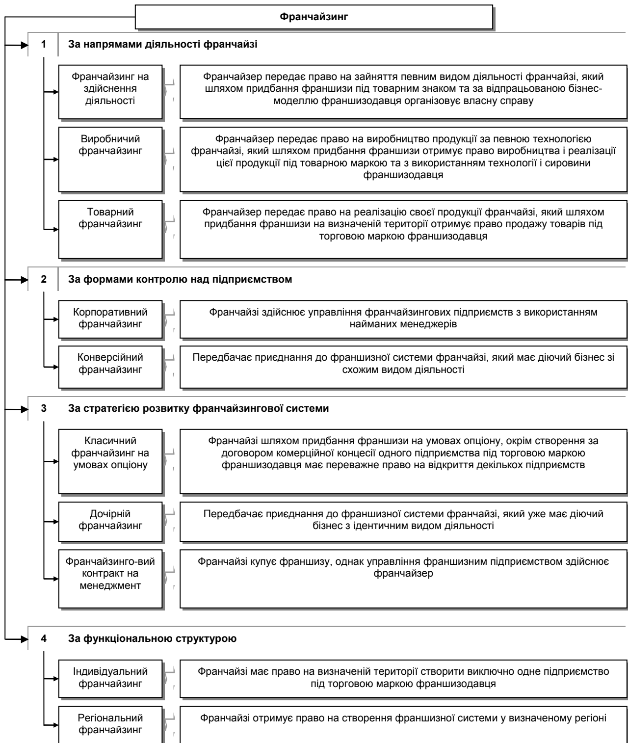
Рис. 1. Основні класифікаційні ознаки франчайзингу та їх характеристика