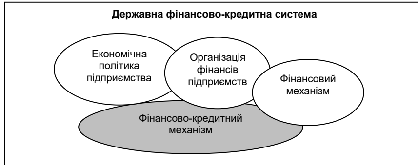
Рис. 2. Формування фінансово-кредитного механізму

розвитку підприємницької діяльності у туристичній галузі (мікrokредитування, пільгове кредитування, державне субсидювання, лізинг, тренінги з фінансово-кредитних питань для туристичних підприємств). Схема формування фінансово-кредитного механізму подано на рис. 2.