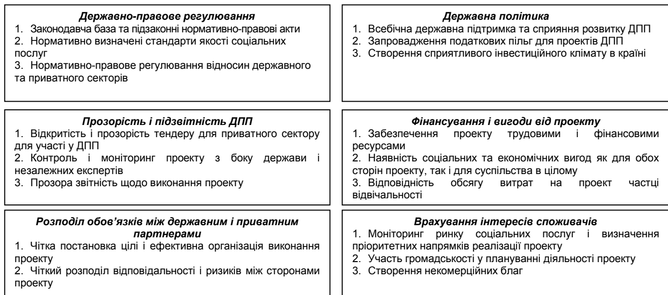
Рис. 1. Основні складові ДПП у соціальній сфері

На нашу думку, розвиток ДПП у соціальній сфері визначається рядом наступних факторів (рис.1).