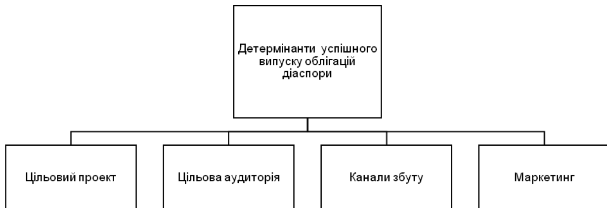
Рис. 1. Детермінанти успішного випуску облігацій діаспори

Уряди Індії та Ізраїлю залучили більше 40 млрд дол США, часто під час криз ліквідності, натиснувши на багатство їхніх громад діаспори для підтримки платіжного балансу і (у разі Ізраїлю) для фінансування проєктів інфраструктури, житла, охорони здоров'я та освіти. Ряд інших країн – у тому числі на Філіппінах, Шрі-Ланці, Кенії, Гані, Непалі та Ефіопії – емітували також облігації для діаспори, але з різним ступенем успіху.