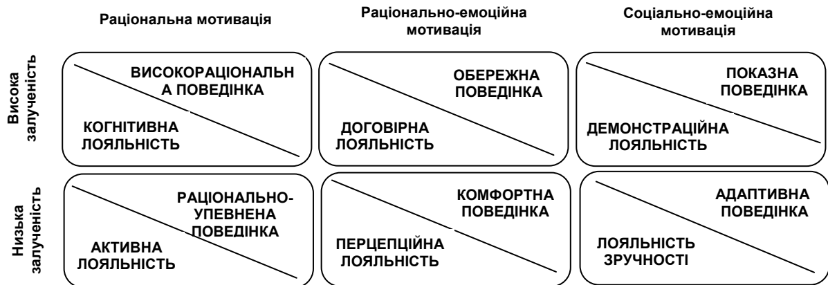
Рис. 3. Типи споживчої лояльності на українському ринку високотехнологічних товарів

За результатами проведеного дослідження нами складено типологію поведінки кінцевих споживачів на вітчизняному ринку високотехнологічних товарів на основі факторів залучення споживачів до процесу купівлі та типу рішення про покупку. Відповідно до кожного типу поведінки визначимо та надамо змістовну характеристику типам лояльності, які потенційно можна сформулювати у споживача (рис. 3).