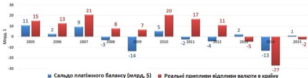
Діаграма 1. Порівняння припливів/відпливів валюти в Україні (млрд, доларів) за класичною та альтернативною методологією

Для підприємця, котрий приймає рішення про вкладення капіталу у власній країні чи вивезення його за кордон, найважливішу роль відіграють два чинники: можливість нагромадження вкладеного капіталу (наприклад, за кордоном, де відносно більша норма прибутку) та гарантії охорони капіталу (чи є такі у власній країні?), щоб не втратити вже існуюче. Та як показує практика, втеча капіталу має місце як в розвинених країнах, так і в країнах, що розвиваються [14, с. 60].