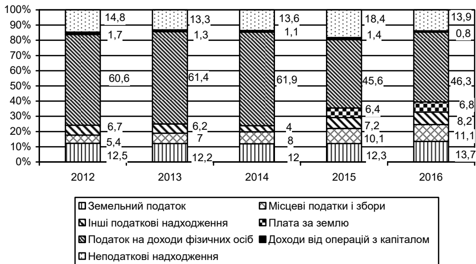
Рис. 3. Структура надходжень місцевих бюджетів, %

шення обсягів інвестування. Крім того, і самі місцеві бюджети стали об'єктом інвестування (рис. 3).