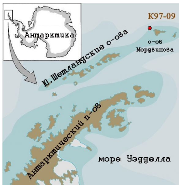
Рис. 1. Схема района работ с расположением станции K98-09 (коорд.: S 60°59,9', W 56°11,4')

Для этого нами была изучена колонка донных морских отложений длиной 45 см, отобранная с борта НИС "Эрнст Кренкель" во время Украинской Антарктической экспедиции 1997-1998 гг. Станция расположена на полигоне возле о. Мордвинова (Elephant Island), глубина моря составляет 1227 м (рис. 1). Остров Мордвинова относится к архипелагу Южные Шетландские о-ва, отделенному от Антарктического п-ова проливом Брансфилда, а от Южной Америки – проливом Дрейка.