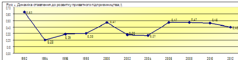
Рис. 2. Динаміка ставлення населення до приватизації (I)

*(Вимірювання за двополярною шкалою, діапазон Індексу середніх величин = -2/+2)