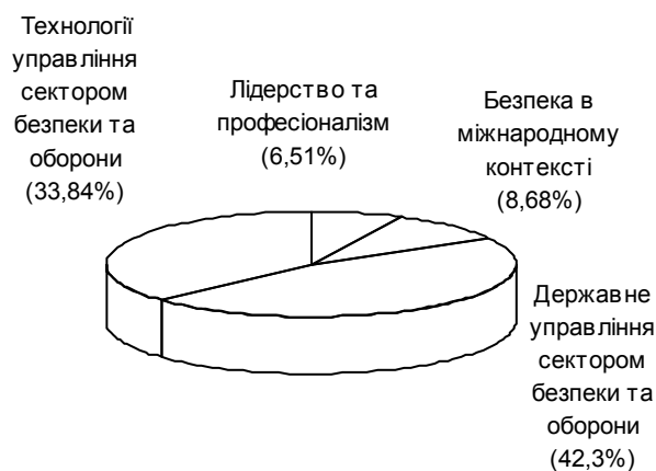
Рис. 2. Розподіл навчальних годин за тематикою національного курсу

Аналіз результатів оцінювання співвідношення тематики курсів показав, що під час проведення національного курсу в порівнянні з міжнародним більш уваги було приділено питанням технологій управління сектором безпеки та оборони (33,84% проти 19,68 %) і менш уваги питанням лідерства та професіоналізму (6,51 % проти 11,56 %) та безпеки у міжнародному контексті (8,68 % проти 28,31 %).