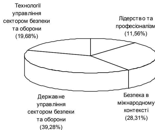
Рис.1. Розподіл навчальних годин за тематикою міжнародного курсу

Практичне вирішення навчальних задач міжнародного та національного курсів здійснювалося під час проведення лекцій та групових практичних вправ. Тематика та кількість навчальних годин дозволили розрахувати співвідношення тематики курсів за 4 основними темами: лідерство та професіоналізм, безпека в міжнародному контексті, державне управління сектором безпеки та оборони, технології управління сектором безпеки та оборони (рис.1, 2).