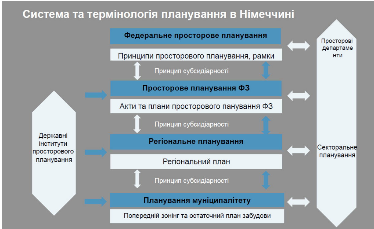
Рис. 2. Система та термінологія планування в Німеччині [4].

На загальнодержавному (федеральному) рівні розробляється рамковий просторовий план розвитку держави, який виконується у масштабі 1:1 000 000. Він визначає принципові (рамкові) засади просторового розвитку ФРН в ув'язці з загальноєвропейськими напрямками просторового розвитку.