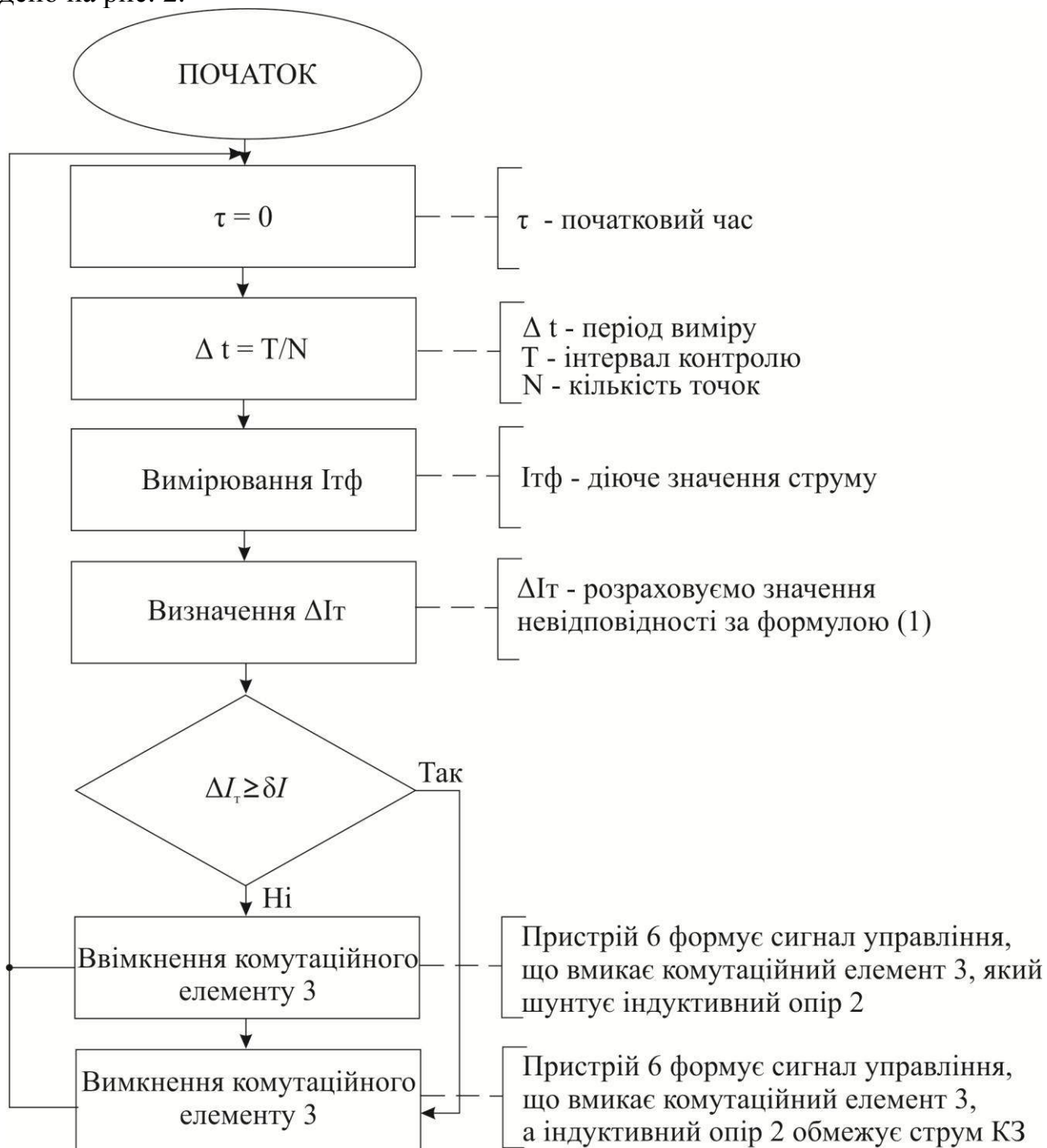
Рис. 2. Алгоритм роботи аналізатора

Алгоритм обмеження струму КЗ системою «реактор – керований шунт», наведено на рис. 2.