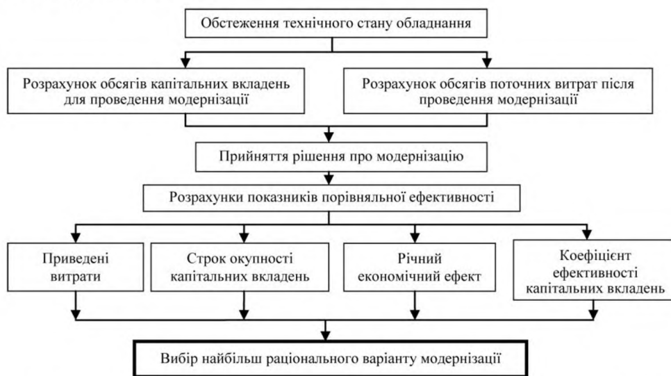
Рис. 3 – Блок-схема техніко-економічного аналізу модернізації хімічного обладнання

Розрахунок річного економічного ефекту можна здійснювати також під час порівняння декількох варіантів інженерних рішень із модернізації (рис. 3). У цьому випадку найбільш раціональним буде інженерне рішення для якого E_\phi є максимальним.