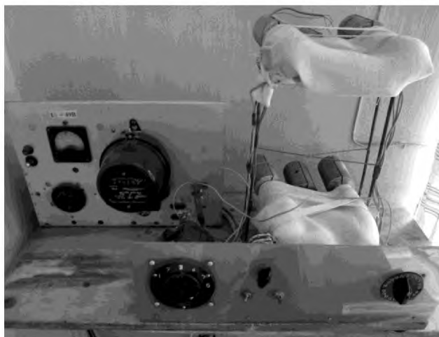
Fig. 1 – Experimental stand for resource studies of low-temperature heat pipes

Heat pipes are installed in a horizontal position and are equipped with electric heaters, aluminum heat sinks- radiators, thermocouples for measuring the temperature of HP. Thermocouples are located on the exterior surface of the HP enclosure along their length. Heat pipes operated cyclically to 9 hours per night. The stand is equipped with Electric Meters permitting control of operating time of HP under load.