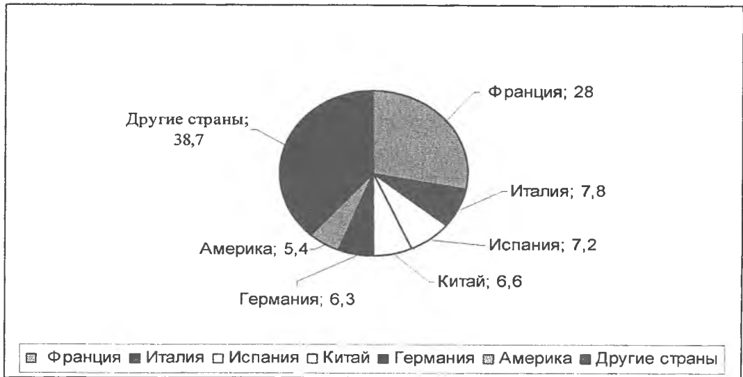
Рис. 2. Распределение импорта Алжира по странам в 2007 г.