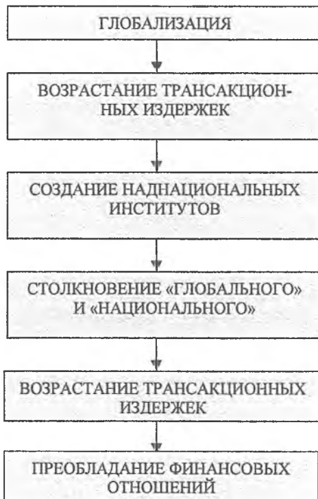
Рис. 2. Логика преобладания финансовых отношений.

Логика преобладания финансовых отношений в современном глобальном пространстве можно представить в виде схемы: