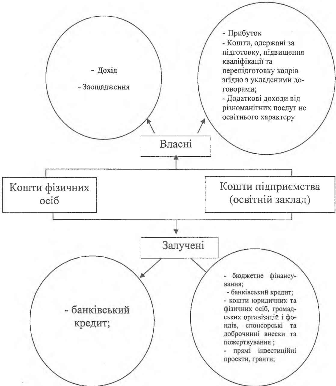
Рис.1. Класифікація джерел фінансових ресурсів людського капіталу*.

Фінансові ресурси суб'єктів господарювання та домогосподарств співіснують у тісному взаємозв'язку, де фінансові ресурси людського капіталу також не є виключенням. Розвиток людського капіталу позитивно відобразиться як на розвитку діяльності суб'єктів господарювання, так і на діяльності домогосподарств, тому що завдяки розвитку людського капіталу відбувається інноваційний прогрес у промисловості. Можна зазначити, що імовірні джерела фінансових ресурсів цих трьох категорій схожі: кошти державного бюджету, кошти місцевих бюджетів, доходи або прибуток та заощадження, кредити банків та інших позик, кошти іноземних інвесторів, кошти вітчизняних інвесторів, інші джерела фінансування.