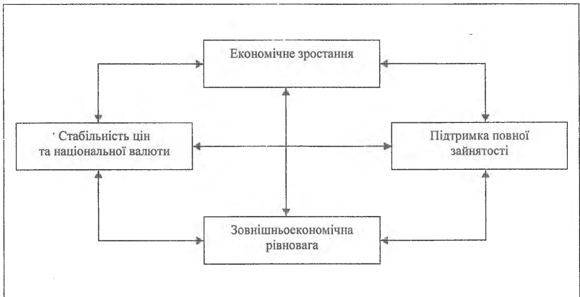
Рис. 1. Багатокутник цілей державного управління Я. Тімберген [15, с. 42]

В економічній літературі розрізняють головну глобальну мету державної політики у сфері економіки – високий рівень суспільного добробуту, та чотири групи цілей, що витікають з неї, які виділив Я. Тімберген та представив їх взаємозв'язок графічно (рис. 1):