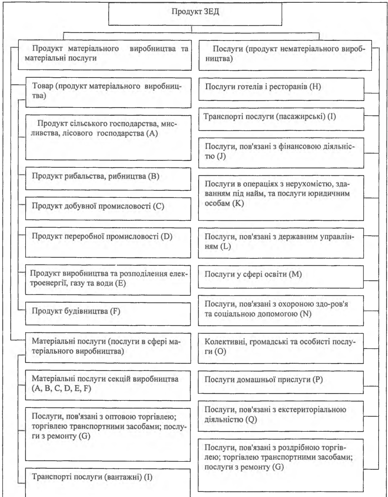
Рис. 3. Класифікація видів зовнішньоекономічного продукту за результатом порівняння та узагальнюючи класифікатори КВЕД та КП ЗЕД

Таким чином сформовано уявлення, що таке зовнішньоекономічний продукт і яким він може бути: