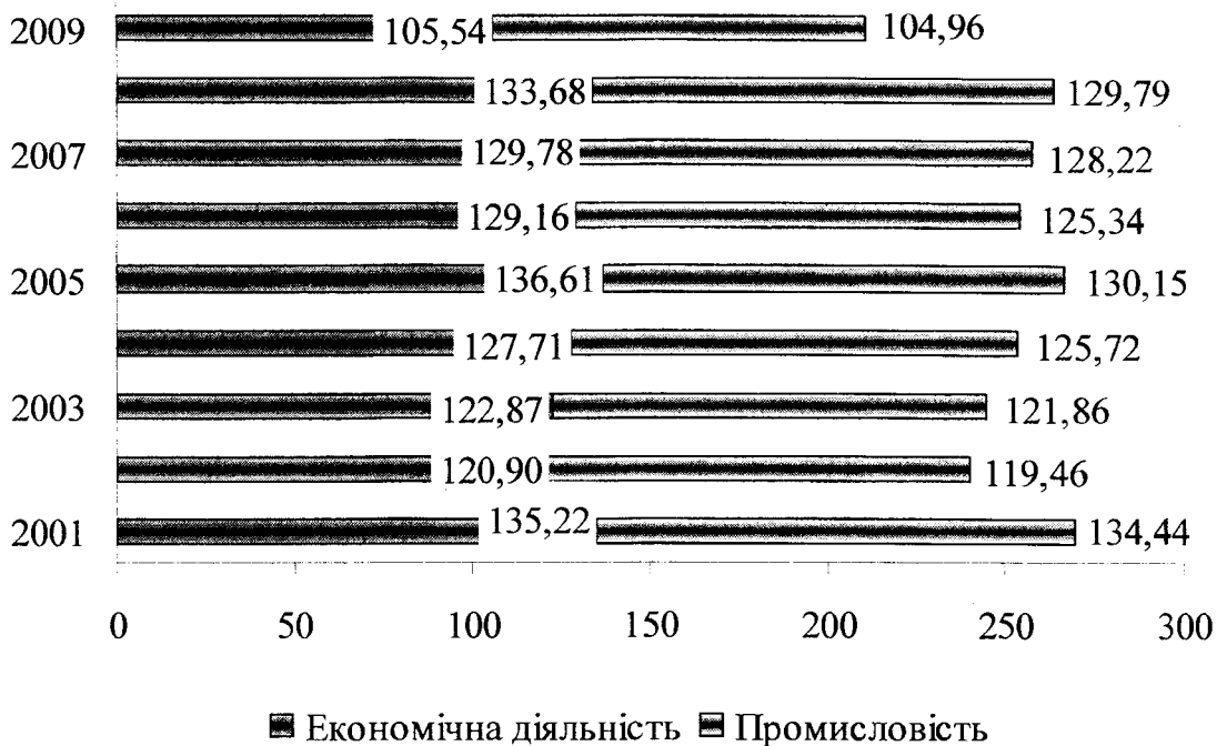
Рис. 3. Порівняльний аналіз темпів росту заробітної плати у промисловості та галузях економічної діяльності за 2001–2009 рр., %

підприємств, в основному вона пояснюється руйнацією державного сектора, спадом виробництва, кризою збуту, неплатежами та фінансовими негараздами.