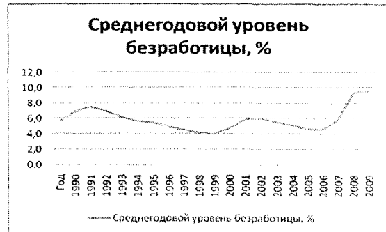
Рис.4. Динаміка середньорічного рівня безработиці США [13]

Таким образом, популярний на сьогоднішній день інструмент мирової глобалізації - аутсорсинг наніс непоправимий врід економіці США. В цілях локалізації негативних наслідків аутсорсинга необхідно виявити помилки, повлекші за собою процес безработиці.