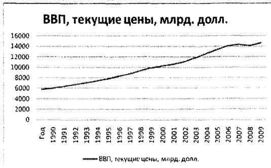
Рис.3. Динаміка ВВП США [12]

Такая динамика роста ВВП возможна лишь в краткосрочном периоде, ведь рост безработицы продолжается, что в свою очередь влияет на снижение спроса на внутреннем рынке страны, влечет сокращение уровня доходов населения, соответственно это ведет к уменьшению налоговых поступлений в бюджет; уменьшается количество новых предприятий и т.д. что, в конечном счете, приведет к снижению ВВП.