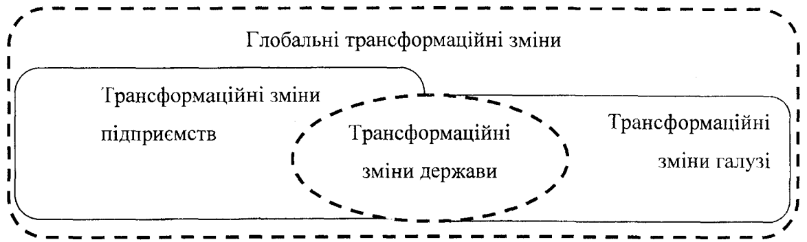
Рис. 1. Система трансформаційних змін в процесі глобалізації

Систему змін, що відбуваються у процесі глобалізації та місце внутрішньодержавних перетворень можна представити у наступному вигляді рис. 1.