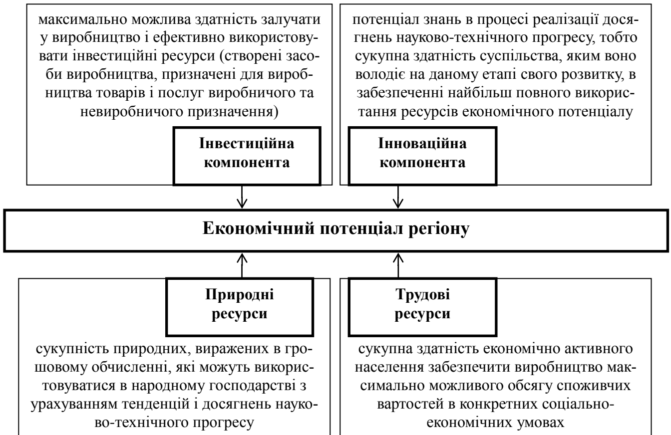
Рис. 1. Складові компоненти економічного потенціалу (складено автором за даними [2]).

Традиційно, економічний потенціал розуміють як «здатність наявних у межах регіону економічних ресурсів забезпечити виробництво максимально можливого обсягу матеріальних послуг, відповідних потребам суспільства на даному етапі його розвитку» [6]. Економічний потенціал регіону включає чотири головні компоненти (інвестиційний, інноваційний, природний, трудовий), які в свою чергу є складовими сукупного економічного потенціалу (рис. 1). У сумарному обчисленні економічний потенціал Харківської області можна оцінити в 24444 млн.грн (станом на 2011 рік). Найбільш вагома компонента в економічному потенціалі регіону – інвестиційний потенціал. В економічному потенціалі Харківської області на інвестиційну складову доводиться 42,8%, трудовий потенціал – 36,1%, природно-ресурсний потенціал – 21,1% [2,7,9].