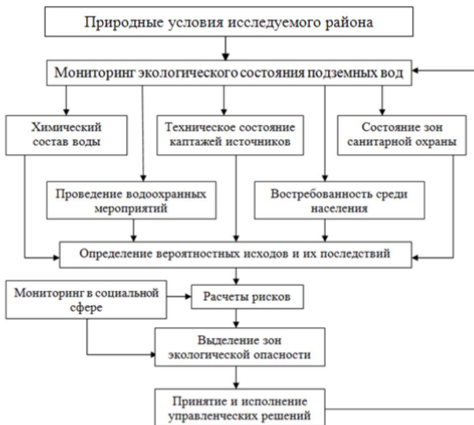
Рис. 2. Алгоритм расчета экологического риска при использовании подземных источников водоснабжения

Немаловажную роль в процедуре оценки экологического риска играют достоверность и полнота первичной информации, в том числе упорядоченная информация о природных условиях и фоновых показателях исследуемого района. Данные о химическом составе подземных вод, техническом состоянии каптажей источников, скважин и колодцев, состоянии зон санитарной охраны и проводимых водоохраных мероприятиях, а также востребованности среди населения составляют основу алгоритма расчета экологического риска при использовании подземных источников водоснабжения (рис. 2).