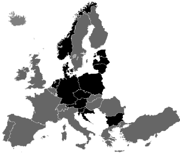
Рис. 2 Поширення подвійного громадянства у деяких країнах Європи

свого постійного перебування і країною походження. Зокрема, спеціально для утримання європейської діаспори в зоні власного впливу, у Туреччині був прийнятий акт про подвійне громадянство, щорічно виділяються кошти на різні культурні програми, спрямовані на конструювання у мігрантів спільної ідентичності [5].