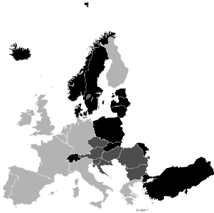
Рис. 1. Поширеність принципу ius soli в деяких країнах Європи