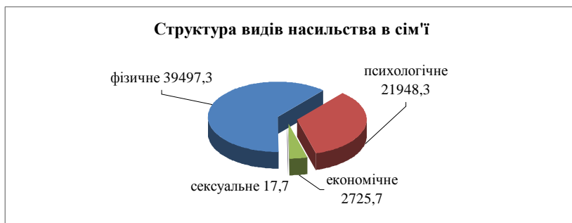
Рис. 2. Розподіл насильства в сім'ї за видами (середня величина за 2004 – 2009 рр.)

По-перше, оскільки для насильства в сім'ї характерна адитивність обсягів (тобто, така його властивість, за якої значення величини, яка відповідає цілому об'єкту, дорівнює сумі значень величин, що відповідають його частинам, незалежно від того, яким чином поділено об'єкт) [11], ми використали метод арифметичної середньої, який обчислюється діленням загального обсягу значень ознаки на обсяг сукупності. Нами були дотримані умови наукового застосування середніх величин: 1) якісно однорідна сукупність; 2) наявність достатньо великої чисельності елементів сукупності; 3) поєднання методу середніх з методом групувань, що дозволяє виділити якісно однорідні групи. В результаті розрахунку середньої арифметичної, структура розподілу видів насильства в сім'ї за 2004–2009 роки набула такого вигляду (рис. 2).