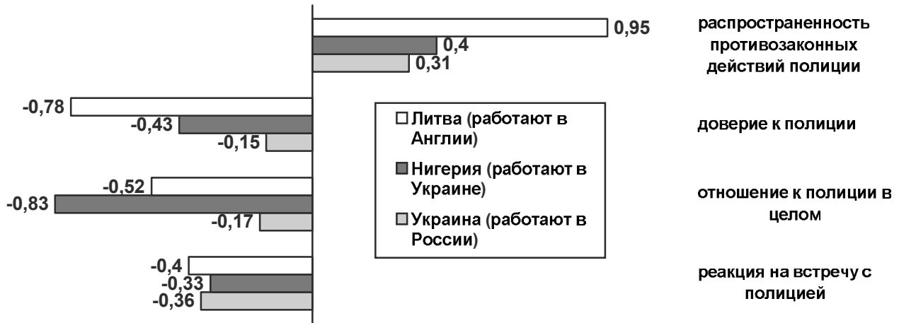
Рисунок 4. Субъективная оценка респондентами различных аспектов работы полиции в родной стране респондента (в индексах от -1 до +1, -1 означает полное отсутствие признака или полностью отрицательную оценку, +1 означает максимальную выраженность признака или полностью положительную оценку).

Мы видим совершенно другую картину оценки работы полиции в родной стране респондентов. Здесь нет противоположных оценок, все оценки имеют общий знак - отрицательный. Оценивая распространенность противозаконных действий полиции, респонденты из Украины и России указывают, что противозаконные действия полиции на их родине скорее распространены, а в Литве – повсеместно распространены. Доверие к полиции в Литве также оказалось наименьшим, а реакция на встречу с полицией – наихудшей. Таким образом, литовские мигранты дают «полярные» оценки работе полиции у себя на родине и в стране назначения миграции (Англии).