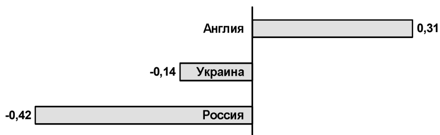
Рисунок 1. Субъективная оценка распространенности преступности среди трудовых мигрантов в стране назначения миграции (Англии, Украине и России) (в индексах от -1 до +1, -1 означает полное отрицание существования проблемы преступности среди мигрантов, +1 означает полное согласие с существованием такой проблемы).

Центральным предметом исследования являлась преступность в среде мигрантов. Субъективная оценка распространенности проблемы преступности среди мигрантов представлена на рисунке 1. Оказалось, что респонденты в России склоняются к отрицанию существования проблемы преступности среди мигрантов, а вот респонденты в Англии и скорее признают существование этой проблемы, чем нет.