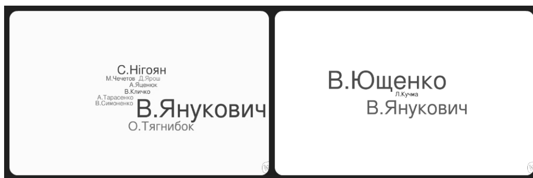
Рисунок 4. Маркер постатей «революції гідності» та «помаранчевої революції»

Абсолютно іншою є ситуація з маркером постатей у текстах, присвячених «революції гідності». Тут усіх лишає позаду, власне, одна особа, яка була об'єктом, що породжував більшість протестних настроїв. З іншого боку, у WordCloud представлено низку лідерів «революції гідності», однак це не політики так званого першого ешелону. Швидше, це ті, кого сучасна молодь бачила сподвижниками революційного руху. Проте, на цьому перелік згадуваних постатей не завершується. В текстах є згадування С. Нігояна, який виступає знаковою фігурою в подіях «революції гідності». Сьогодні його постать фактично символізується 8 в українському суспільстві й набуває ознак національного символу боротьби. В текстах зустрічаються описи й про декількох інших осіб, які, зокрема, загинули під час розстрілів й віднесені до героїв «Небесної сотні», однак через те, що вони знеособлені, їхні імена не вказуються (вони не потрапили до WordCloud).