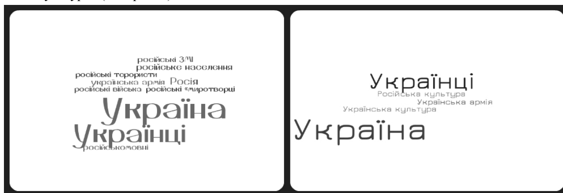
Рисунок 5. Маркери протистояння ідентичностей «революції гідності» та «помаранчевої революції»

Маркери протистояння ідентичностей. У даному випадку під протистоянням ідентичностей мається на увазі протистояння «Україна – Росія», яке гостро артикулюється сьогодні. І не дивним є те, що період «помаранчевої революції» отримує поодинокі звернення до російського світу лише у формі «російська культура» (див. рис. 5).