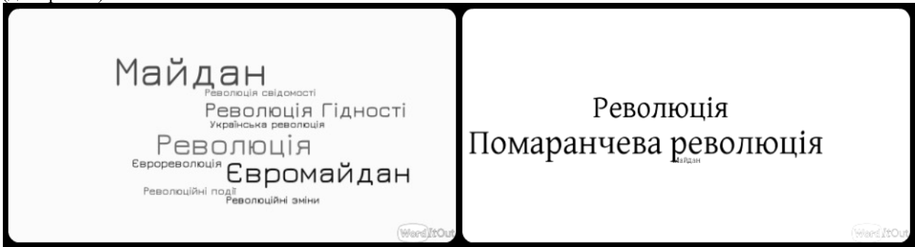
Рисунок 3. Маркери найменувань «революції гідності» та «помаранчевої революції»

Маркери найменувань. Обидві українські революції ХХІ ст. відбулись через так званий «Майдан». Вони починались на головній площі країни – майдані Незалежності, а згодом виливались у чисельні місцеві майдани. Проте основні події революцій відбувались у місці зародження. Тому часто маркери найменування революцій у текстах формуються через маркери територіального розташування . Однак відмінність між описами «помаранчевої революції» та «революції гідності» в даному розрізі разюча (див. рис. 3).