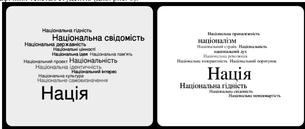
Рисунок 6. Маркери національної належності «революції гідності» та «помаранчевої революції»

Маркери національної належності. О. Михайлова підкреслює, що українська революція 2013-2014 підживлювалася меморіальними маркерами ідентичності й була усвідомлена як національна [4]. Автор ґрунтується на тому, що мобілізаційний потенціал національного питання є надзвичайно потужним. Національне питання під найрізноманітнішими кутами розгляду артикулюється і в описах революцій в автобіографічних текстах студентів (див. рис. 6).