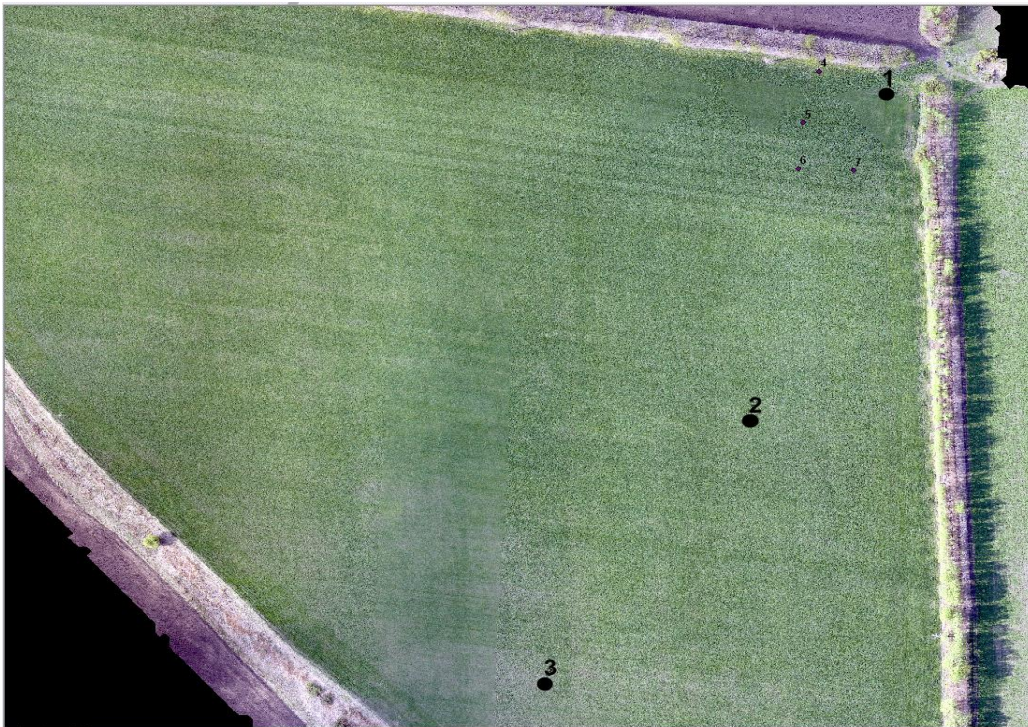
● 1 – точки відбору зразків