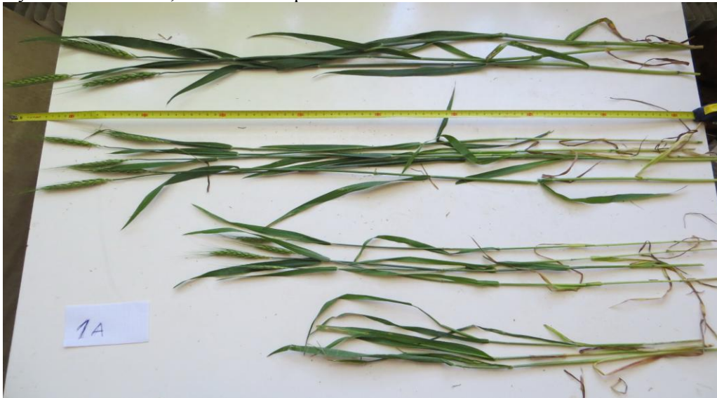
Тчк. 1а (Розташована поряд з тчк. 1) максимальна висота рослин – 104 см, середня – 95 см

рахункова біомаса, що розраховувалась як добуток кількості рослин на м 2 та середньої ваги одної рослини, визначеної при аналізі пробного снопа (без урахування недорозвинених рослин, що не включались у підрахунок чисельності рослин в полі).