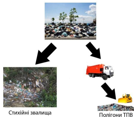
Рис. 3 – Існуюча система поводження з ТПВ в смт. Бабаї та с. Затишне

Таким чином, схема збирання та поводження з відходами в селищах має змінено найбільш ефективним, раціональним та прийнятним чином (рис.2).