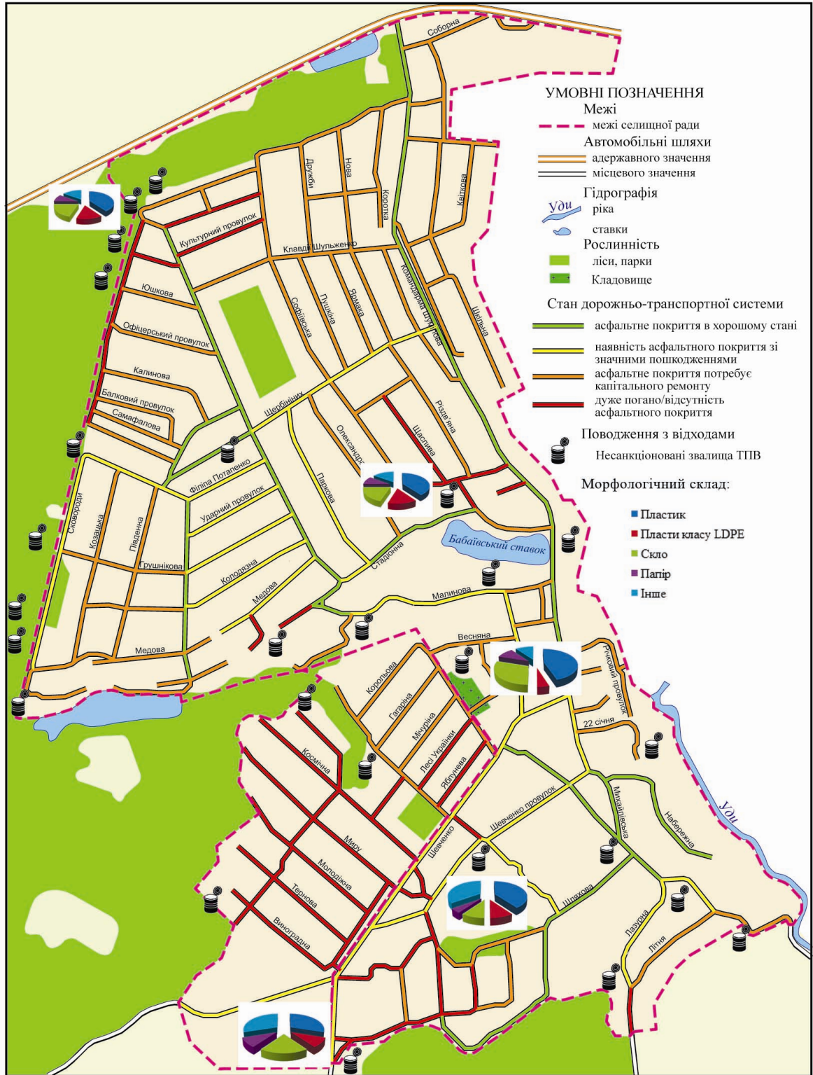
Рис. 1 – Несанкціоновані звалища смт Бабаї та с. Затишне

диться на відстані 10 м від вул. Сковороди. Об'єкт має витягнуту форму, розташований вздовж ґрунтової дороги, що проходить лісом. Звалище складається з комплексу точкових об'єктів. Стан дорожнього покриття вул. Сковороди оцінюється в три ба-