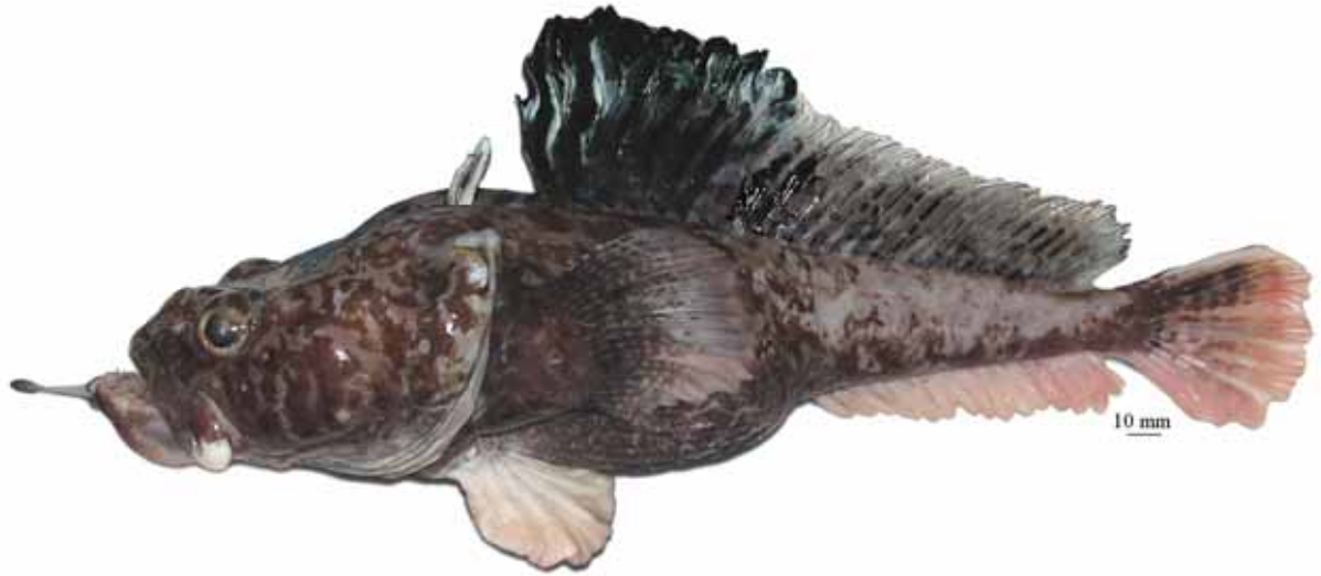
Рис. 8. P. neyelovi , голотип (МПХНУ Р299), самец, 355 мм TL, 295 мм SL, море Росса Fig. 8. P. neyelovi , holotype (MNKhNU R299), male, 355 mm TL, 295 mm SL, Ross Sea

налегающими друг на друга чешуевидными придатками с фестончатыми верхними краями; общая окраска тела светлая; верх головы, затылок и спина перед первым спинным плавником покрыты четкими, главным образом округлыми темными пятнами. Прибрежный вид, известный лишь по голотипу (молодому самцу, 147 мм SL), пойманному на глубине 651–742 м у Земли Королевы Мод (Индоокеанский сектор) . . . . чешуйчатая бородачка P. squamibarbata Eakin et Balushkin, 2000