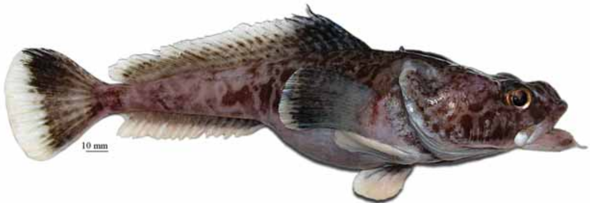
Рис. 5. P. barsukovi , самка, 270 мм TL, 222 мм SL, море Росса Fig. 5. P. barsukovi , female, 270 mm TL, 222 mm SL, Ross Sea

2a. Нижняя поверхность головы, грудь, живот и основания грудных плавников покрыты относительно крупными, контрастными тёмными пятнами; подбородочный усик (9,8–12,9 % SL) толстый и двуцветный, с крупными, контрастными темными пятнами на светлом стебле, часто довольно густо покрытом папиллами, и светлым, длинным (50–66 % длины усика), кустистым терминальным расширением, образованным длинными, тонкими, заостренными на вершине, неветвящимися и ветвящимися отрезками; вершина нижней челюсти заострена или более или менее закругленная, заметно выдается вперед; при закрытом рте обнажены все ряды зубов на симфизе и часто передний край языка; второй спинной плавник у взрослых самцов пестрый и умеренно высокий (до 22% SL), с небольшой передней лопастью. Прибрежный вид, известный с глубин 247–460 м в морях Уэдделла и Космонавтов; достигает общей длины 260 мм (214 мм SL) (рис. 6) . . . . . . . . . . пятнистобрюхая бородатка P. ventrimaculata Eakin, 1987