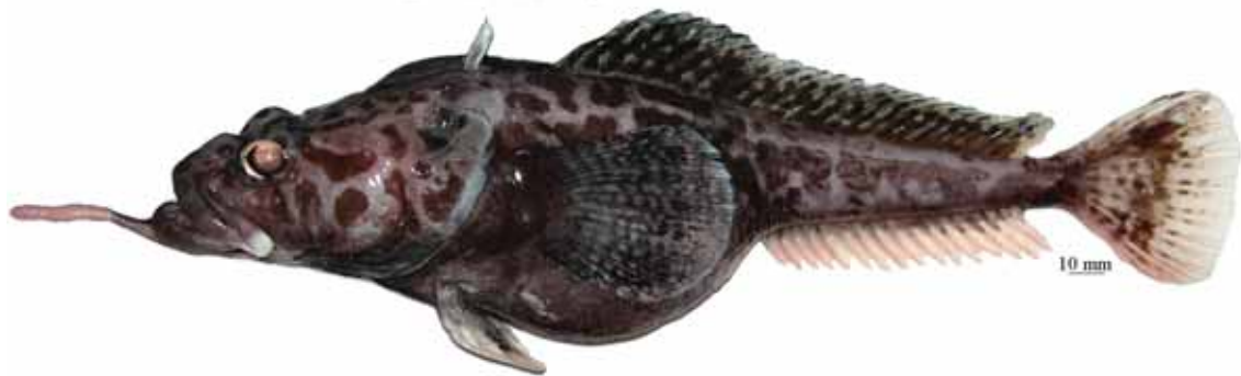
Рис. 12. P. sp. E , самка, 286 мм TL, 224 мм SL, море Амундсена Fig. 12. P. sp. E , female, 286 mm TL, 224 mm SL, Amundsen Sea