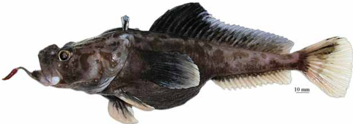
Рис. 10. P. sp. C , самец, 260 мм TL, 208 мм SL, море Росса Fig. 10. P. sp. C , male, 260 mm TL, 208 mm SL, Ross Sea

известный лишь по голотипу (самцу: 234 мм TL, 197 мм SL), пойманному на глубине 1947 м в море Беллинсгаузена . . . . . лысая бородатка P. bellingshausenensis Eakin, Eastman et Matallanas, 2008 4d. Подбородочный усик более или менее утолщенный, контрастно двуцветный, с ярко-красным (выцветающим до светлого у фиксированных рыб) терминальным расширением и темным стеблем; терминальное расширение умеренной длины (менее 50% длины усика), заметно более широкое, чем прилегающая часть стебля; общая окраска тела светло-коричневая; верх головы, затылок и спина перед первым спинным плавником покрыты четкими, преимущественно округлыми темными пятнами; второй спинной плавник у взрослых самцов черный в передней части, умеренно высокий (до 22% SL), с небольшой передней лопастью. Глубоководный вид, известный по двум экземплярам общей длиной до 300 мм (250 мм SL), пойманным на глубине 1090–1470 м в море Росса (рис. 10) . . . . . P. sp. C