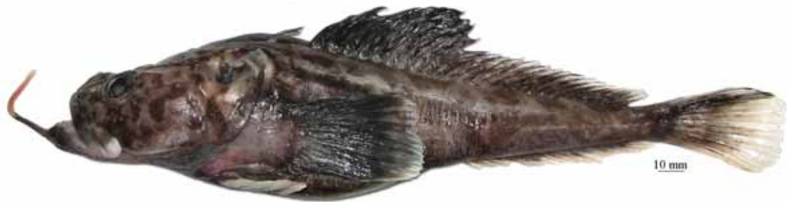
Рис. 11. P. sp. D , самец, 276 мм TL, 224 мм SL, море Амундсена Fig. 11. P. sp. D , male, 276 mm TL, 224 mm SL, Amundsen Sea

6. Подбородочный усик (20–27 % SL) со стеблем, имеющим нечеткую темную пятнистость, и оранжевым (у живых рыб) терминальным расширением, образованным простыми или иногда слабо ветвящимися, очень короткими пальцевидными отростками; темные пятна на голове, затылке и спине перед первым спинным плавником немногочисленные, средние по размеру, более или менее округлые или нечеткие; вершина нижней челюсти угловидно-заостренная и заметно выдается вперед; при закрытом рте зубы на симфизе обнажены. Прибрежный вид, известный по четырем экземплярам (самке: 203 мм TL, 164 мм SL и трем ювенильным особям: 63 мм, 92 мм и 106 мм SL), пойманном на глубине 423–666 м в море Уэдделла . . . . . оранжевоусая бородатка P. orangei Eakin et Balushkin, 1998