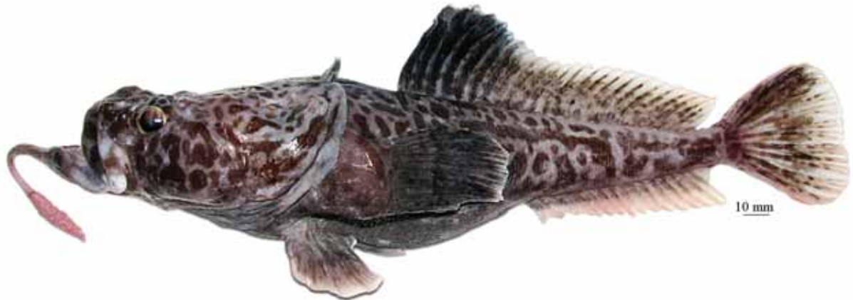
Рис. 13. P. sp. F , самец, 324 мм TL, 257 мм SL, море Росса Fig. 13. P. sp. F , male, 324 mm TL, 257 mm SL, Ross Sea