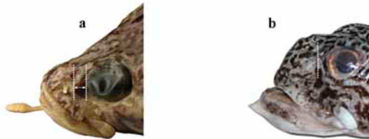
Рис. 4. Два типа формы орбиты у видов Pogonophryne . Прерывистые линии показывают передние границы орбиты и глазного яблока. а – P. marmorata (формалин); наличие антеровентрального выступа, не заполненного глазным яблоком (показано стрелками) – тип, свойственный группе “ P. marmorata ”; б – P. barsukovi ; округлый передний край орбиты с вплотную прилегающим глазным яблоком – тип, свойственный всем прочим группам видов

1b. Подбородочный усик толстый, короткий (около 10–12 % SL), светлый; булавовидное терминальное расширение заметно варьирует в длину (около 30–60 % длины усика), примерно в 2–3 раза шире прилегающей части стебля, образовано толстыми, стоячими, преимущественно продольными, узорчато-гофрированными складками; угловидный орбитальный выступ расположен в антеровентральной части орбиты; второй спинной плавник у взрослых самцов с очень высокой (до 31% SL) передней лопастью. Циркумантарктический, главным образом прибрежный вид, встречающийся на глубинах 140–1405 м; достигает общей длины 210 мм (167 мм SL) (рис. 4а) . . . . . ..... мраморная бородатка P. marmorata Norman, 1938