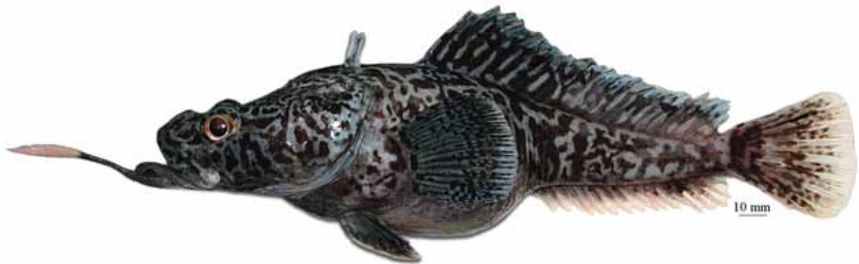
Рис. 14. P. sp. G , самец, 250 мм TL, 203 мм SL, море Амундсена Fig. 14. P. sp. G , male, 250 mm TL, 203 mm SL, Amundsen Sea