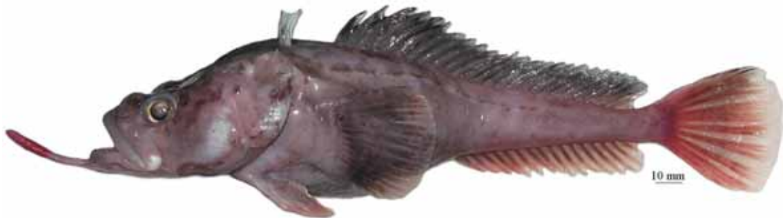
Рис. 2. P. sp. A , самка, 252 мм TL, 200 мм SL, море Амундсена Fig. 2. P. sp. A , female, 252 mm TL, 200 mm SL, Amundsen Sea

общая окраска тела у живых рыб розовая, вокруг пор сейсмодатчиков головы едва видны нечеткие более темные участки. Глубоководный вид, известный по единственной взрослой самке общей длиной 252 мм (200 мм SL), пойманной на глубине около 1000 м в море Амундсена (рис. 2) . . . ..... P. sp. A