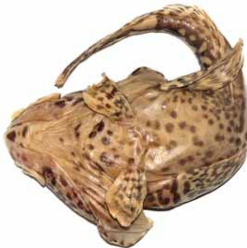
Рис. 6. P. ventrimaculata (формалин), вид снизу, 195 мм TL, 141 мм SL, Море Космонавтов Fig. 6. P. ventrimaculata (formalin), ventral view, 195 mm TL, 141 mm SL, Cosmonauts Sea

2b. Нижняя поверхность головы, грудь, живот и основания грудных плавников окрашены однотонно, без контрастных тёмных пятен; подбородочный усик (8–12 % SL) тонкий и часто двуцветный, с едва выраженным в ширину терминальным расширением или без него; вершина нижней челюсти более или менее закругленная, умеренно или слабо выдается вперед; при закрытом рте могут быть обнажены передние ряды зубов на симфизе и нижнечелюстная дыхательная перепонка . . . . . 3 3a. Подбородочный усик контрастно двуцветный, с однотонно-темным или нечетко пятнистым стеблем и светлым, длинным (51–68 % длины усика), трубковидным терминальным расширением,