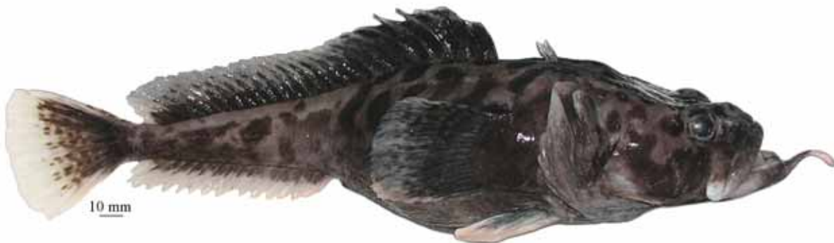
Рис. 7. P. brevibarbata , самка (МПХНУ P298), 325 мм TL, 262 мм SL, море Росса Fig. 7. P. brevibarbata , female (MNKХНУ R298), 325 mm TL, 262 mm SL, Ross Sea

..... хмелеусая бородатка P. neyelovi Shandikov et Eakin, 2013