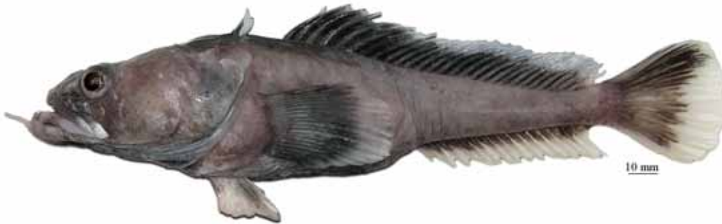
Рис. 1. P. immaculata , самка, 250 мм TL, 202 мм SL, море Росса Fig. 1. P. immaculata , female, 250 mm TL, 202 mm SL, Ross Sea

2a. Подбородочный усик, если имеется, очень короткий (2–9 % SL), белого цвета, притупленный на кончике; общая окраска тела у живых рыб однотонно-сероватая или слегка коричневатая с розоватым оттенком; плавники отчетливо двуцветные: темные или черноватые у основания и светлые или белые у внешнего края; верхний профиль головы выпуклый; голова у посттемпоральных гребней относительно высокая (не менее 20% SL); в срединной боковой линии 12–29 (обычно 16–29) пор; второй спинной плавник у взрослых самцов с высокой (23–27 % SL) черной передней лопастью. Глубоководный вид, известный с глубин 800–2542 м от Южных Оркнейских островов и из моря Росса; достигает общей длины 268 мм (209 мм SL) (рис. 1) ..... ..... непятнистая бородатка P. immaculata Eakin, 1981