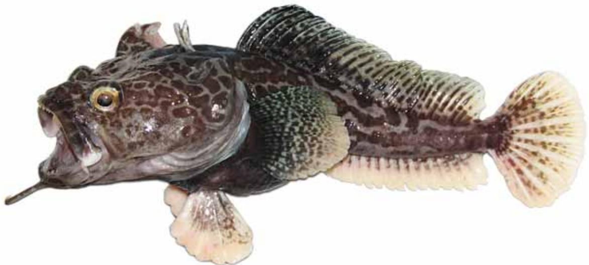
Рис. 9. P. tronio , голотип (МПХНУ Р295), самец, 290 мм TL, 234 мм SL, море Росса Fig. 9. P. tronio , holotype (MNKhNU R295), male, 290 mm TL, 234 mm SL, Ross Sea

4с. Подбородочный усик (13% SL) тонкий, двуцветный, с кремовым (у фиксированных рыб) терминальным расширением и светлым стеблем, покрытым в базальной половине темными пятнами; терминальное расширение закругленное на конце, очень короткое (около 16% длины усика), слабо выраженное, едва шире прилегающей части стебля, образованное короткими пальцевидными отростками; общая окраска тела светлая; верх головы покрыт четкими, преимущественно округлыми темными пятнами; затылок и спина перед первым спинным плавником без пятен; второй спинной плавник у самцов пестрый, очень низкий (около 14% SL), без передней лопасти. Глубоководный вид,