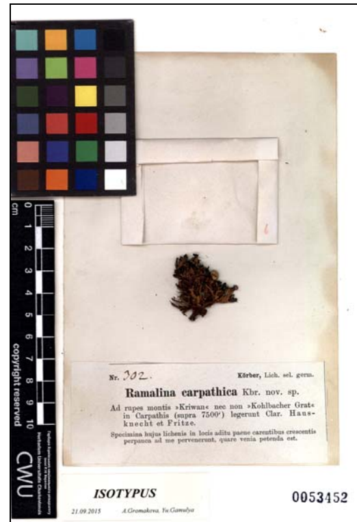
Ramalina carpathica Körb.