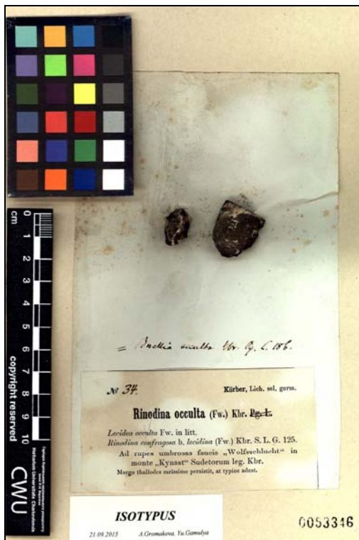
Buellia occulta Körb.