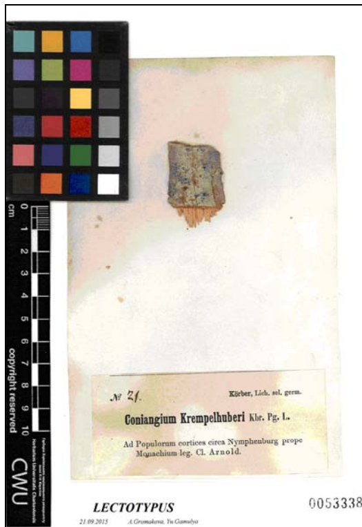
Coniangium krempelhuberi Körb.