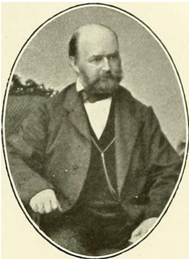
Рис. 1. Густав Вильгельм Кёрбер (Gustav Wilhelm Körber)

Данная статья посвящена инвентаризации в Гербарии CWU коллекции "Lichenes Selecti Germanici" Г.В.Кёрбера (Gustav Wilhelm Körber; 1817–1885) – крупнейшего немецкого лихенолога XIX века (рис. 1.).