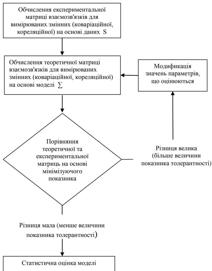
Рис. 1 Основні етапи обчислення та статистичної оцінки моделі.

Для діагностики стратегій і моделей опанування використовувався запитальник SACS «Стратегії подолання стресових ситуацій» С. Хобфолла, створений на основі багатовимірної моделі поведінки [4].