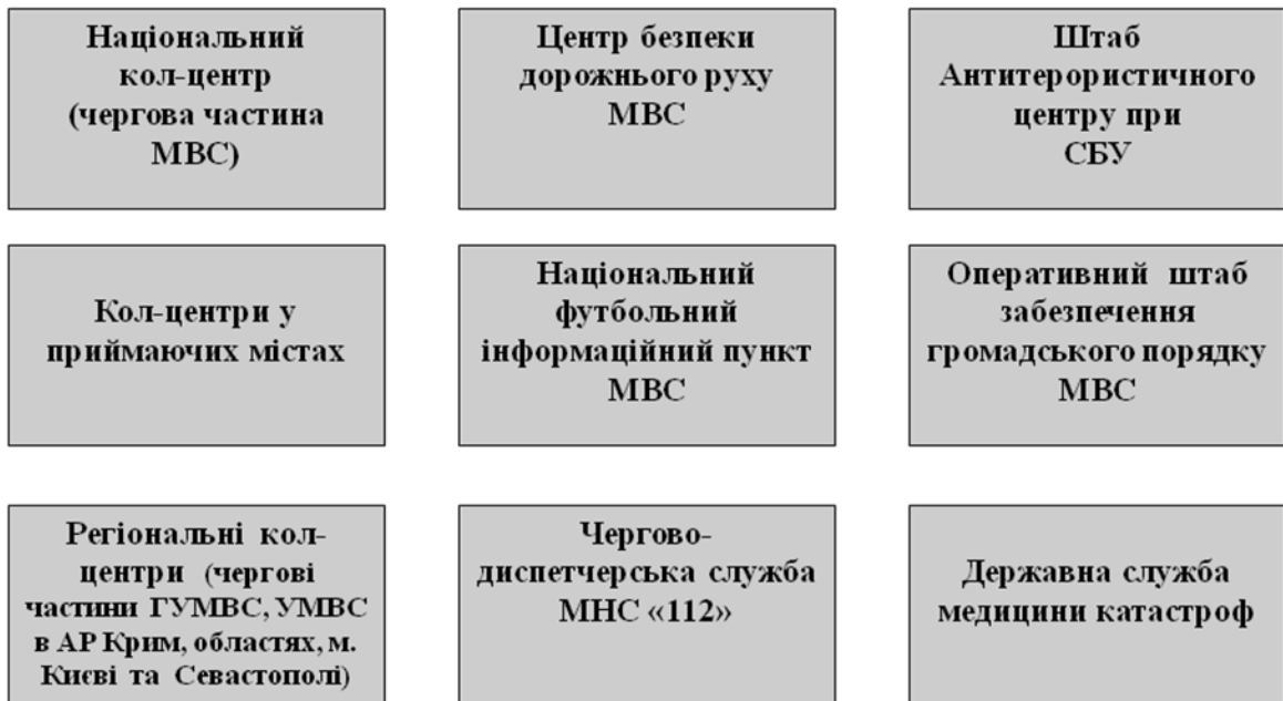
Рис 1. Схема координаційного центру безпеки Євро-2012

Де на верхній схемі показаний повсякденний режим функціонування психологічних служб, а на нижній схемі – режим функціонування при виникненні надзвичайної ситуації.