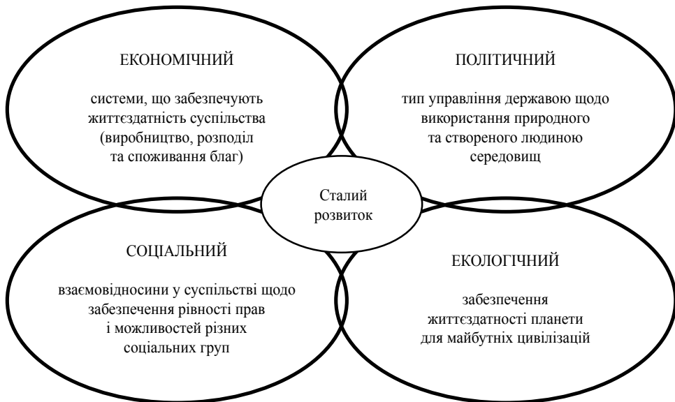
Рис. 1. Взаємозв'язок основних складових сталого розвитку

Сталий розвиток має чотири основні складові: економічну, екологічну, політичну та соціальну (рис. 1).