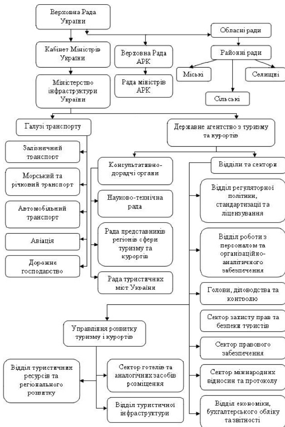
Рис.2. Система державного регулювання галузі туризму в Україні